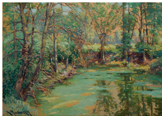
Lesní tůň Olej na kartonu Pool in the forest oil on carton