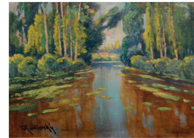
Slepé rameno Labe Olej na kartonu Dead river channel of Labe oil on carton