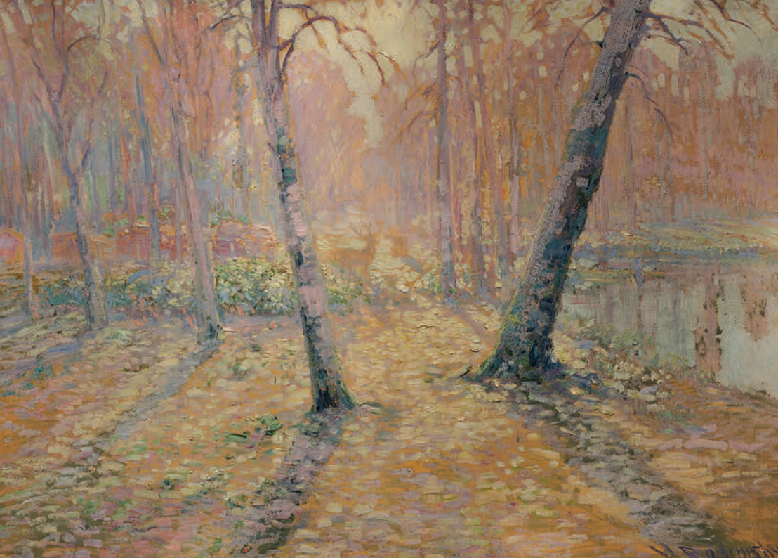
Jitro Olej na kartonu Morning oil on carton