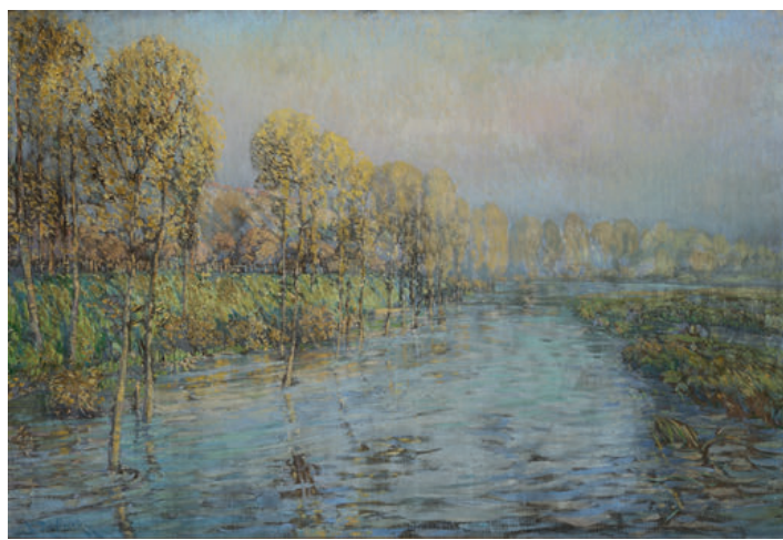
Letní labské zákoutí II. Olej na kartonu Creek of Labe in Summer II. oil on carton