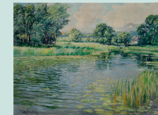
Mrtvé rameno Labe Olej na kartonu Dead river channel of Labe oil on carton