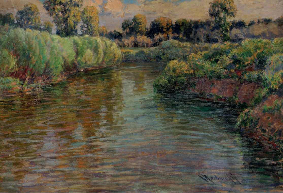
Letní labské zákoutí I. Olej na kartonu Creek of Labe in Summer I. oil on carton