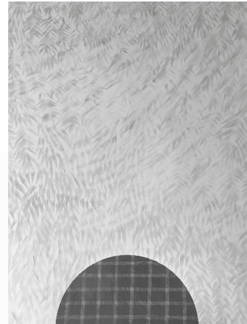
KATEŘINA DOBROSLAVA DRAHOŠOVÁ Bez názvu, 2019 ▲ 84,1 x 59,4 cm kresba na papíru