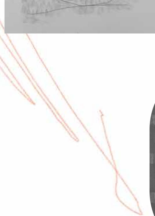
KATEŘINA DOBROSLAVA DRAHOŠOVÁ Struktury, 2018 ◀ 29,7 x 21 cm kresba na papíru