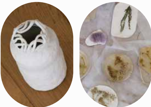
NIKOLA BRABCOVÁ Objekty ▼ 2018