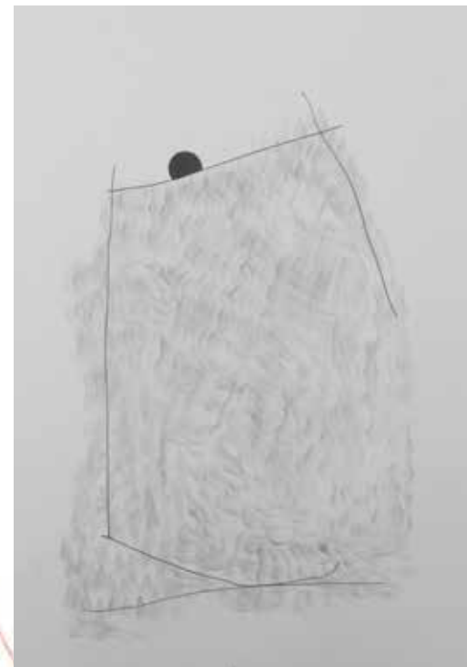
KATEŘINA DOBROSLAVA DRAHOŠOVÁ Z cyklu „Nositelé“, 2018 ▶ 29,7 x 21 cm kresba na papíru