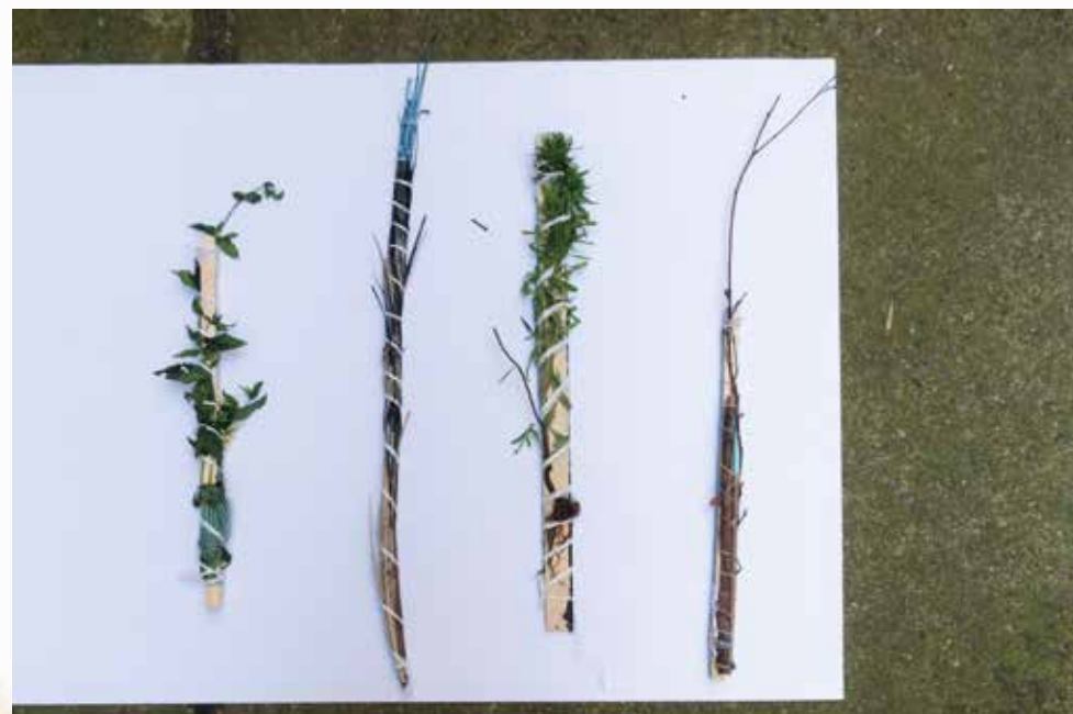
NIKOLA BRABCOVÁ Objekty ▲ 2018