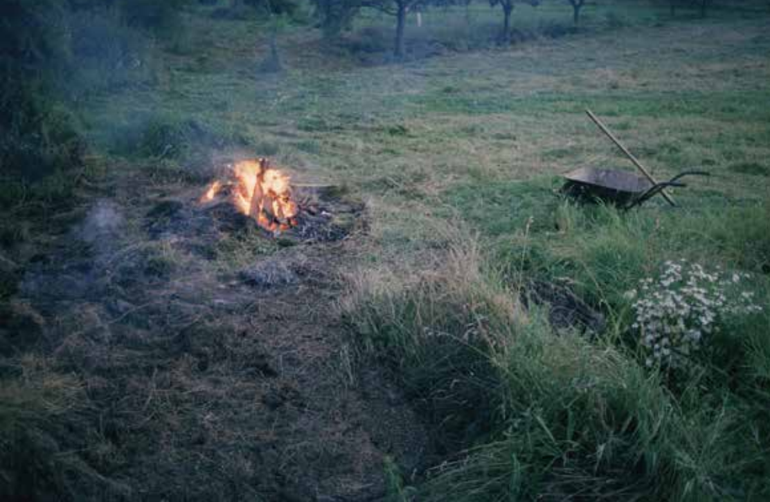
TOMÁŠ HRŮZA Z cyklu „Místo ničeho“ ▲ 2016 – 2019