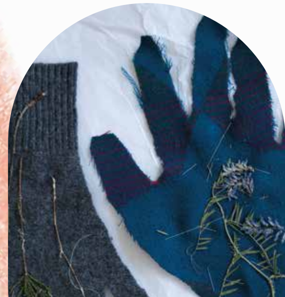
NIKOLA BRABCOVÁ Objekty ▼ 2018