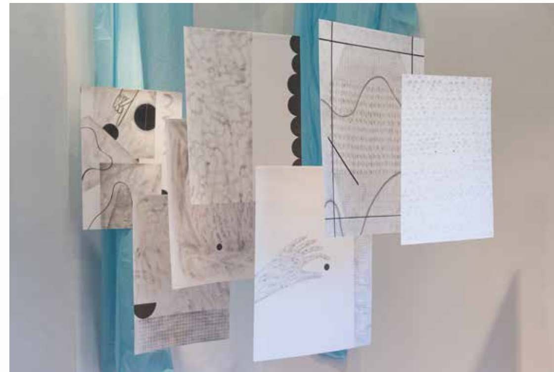
KATEŘINA DOBROSLAVA DRAHOŠOVÁ Medicimbal, 2017 / Altán Klamovka ▲ kresba na papíru