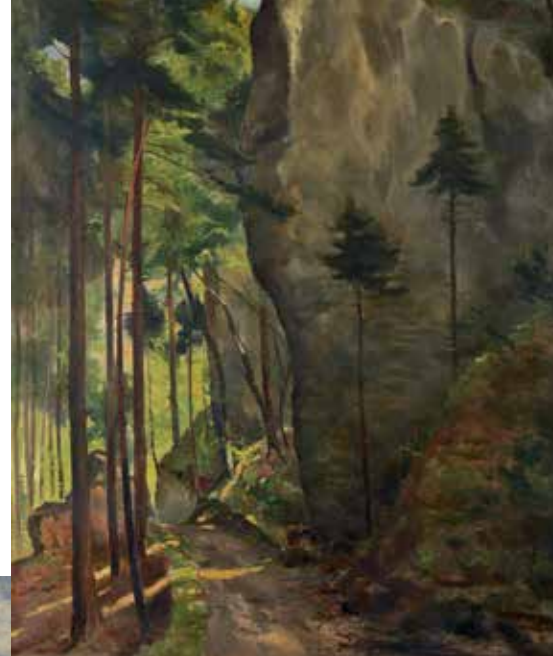
Karel Jan Sigmund, Na Kokořině Signováno: K. J. Sigmund 36