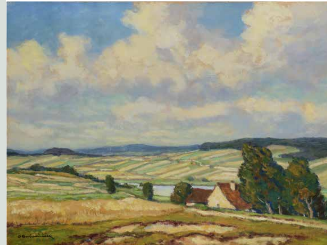
Ota Bubeníček, Krajina u Vožice Signováno: O. Bubeníček

Patřil k aktivním členům Osmy a Skupiny výtvarných umělců (1911–14). Po pokusech s kubismem se přiklonil ke krajinomalbě. Byl výrazným koloristou.