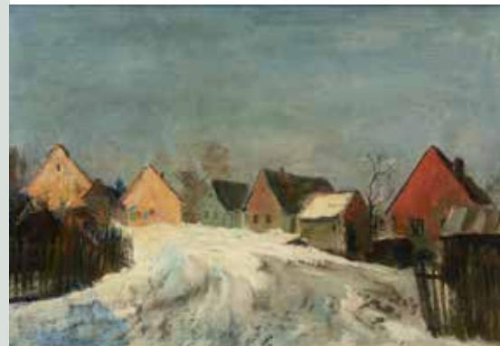
Karel Jan Sigmund, Zimní krajina Signováno: K. J. Sigmund