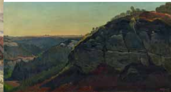
Otakar Nejedlý, Skály u Kokořina Signováno: Ot Nejedlý