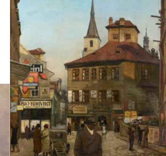
Josef Tomáš Blažek, Stará Praha Signováno: J. T. Blažek, únor 1930, Praha