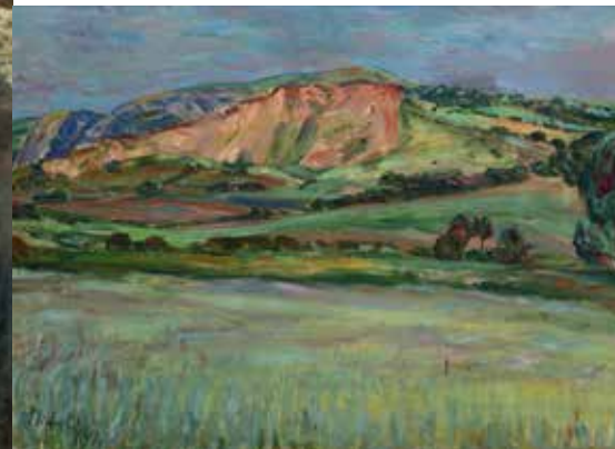
Miloslav Holý, Krajina Džbán , Signováno: M. Holý 41