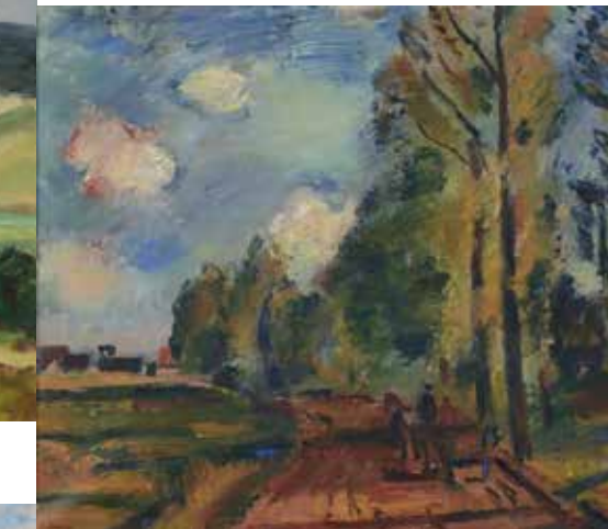
Bohumil Lonek, Cesta Signováno: B. Lonek