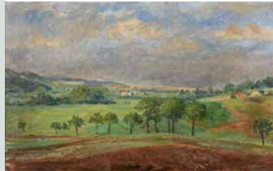
Vlastimil Rada, Krajina u Hrubé skály

Malbu studoval na Akademii u Jana Preislera, Vlahy Bukovace a Jakuba Obrovského. Byl představitelem expresivní malby, při níž používal pastózní techniku. Vedle pražské periferie rád maloval krajinu. Spolu s Karlem Holanem, Pravoslavem Kotíkem a sochařem Karlem Kotrbou založili v r. 1924 Skupinu sociální malby Ho Ho Ko Ko. 3 roky společně pracovali a do r. 1927 vystavovali v Praze a v Brně.