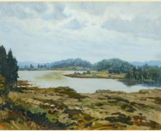
Jaroslav Panuška, 1872 – 1958 Jezero / The Lake ČS Hradec Králové