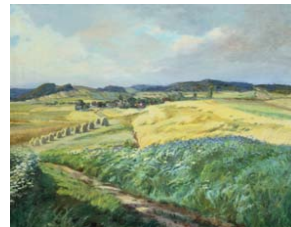
Gustav Porš, 1888 – 1955 Letní soumrak / Summer Nightfall ČS Liberec