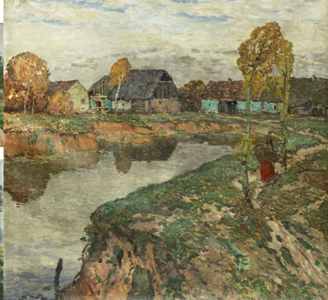
Josef Ullmann, 1870 – 1922 Náves / Village Square ČS Chrudim