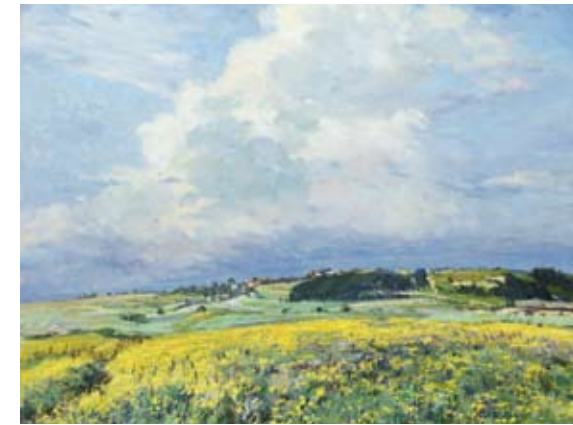
Gustav Porš, 1888 – 1955 Kvetoucí louka / Flowering Meadow ČS Praha 1, Vodičkova