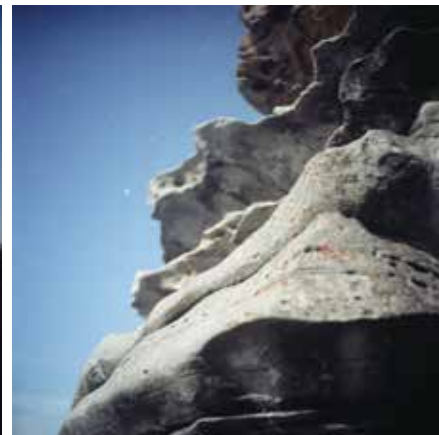
HRANICE MODRÉ THE LIMIT OF BLUE, 2019 100 x 100 cm ▼ LightJet osvit na Fuji Crystal Archive adjustace na dibond edice 1 kus