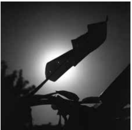
HRANICE MODRÉ THE LIMIT OF BLUE, 2019 100 x 100 cm ▼ LightJet osvit na Fuji Crystal Archive adjustace na dibond edice 1 kus