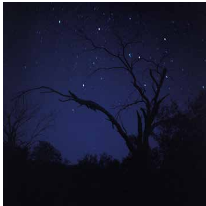
HRANICE MODRÉ THE LIMIT OF BLUE, 2019 100 x 100 cm ▶ Print na Polimat laser 090 MIC edice 1 kus