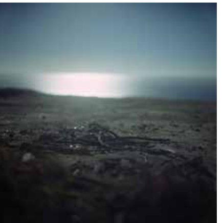
HRANICE MODRÉ THE LIMIT OF BLUE, 2019 100 x 100 cm ▼ LightJet osvit na Fuji Crystal Archive adjustace na dibond edice 1 kus