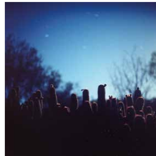
HRANICE MODRÉ THE LIMIT OF BLUE, 2019 100 x 100 cm ▶ Print na Polimat laser 090 MIC edice 1 kus