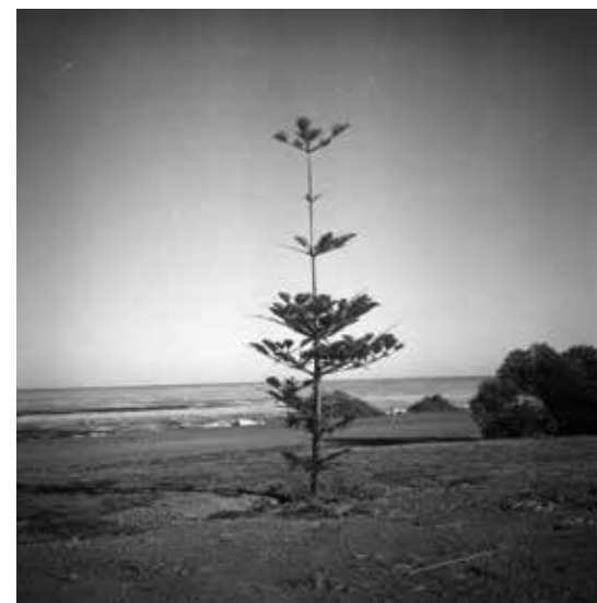
HRANICE MODRÉ THE LIMIT OF BLUE, 2019 100 x 100 cm ▲ LightJet osvit na Fuji Crystal Archive adjustace na dibond edice 1 kus