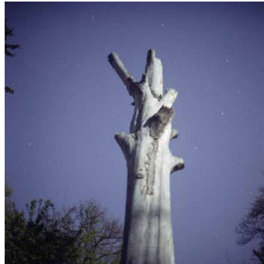
HRANICE MODRÉ THE LIMIT OF BLUE, 2019 100 x 100 cm ▲ LightJet osvit na Fuji Crystal Archive adjustace na dibond edice 1 kus