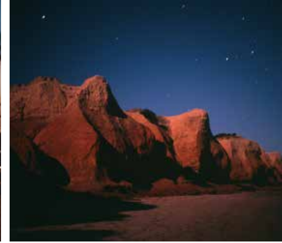
HRANICE MODRÉ THE LIMIT OF BLUE, 2019 100 x 100 cm ▲ Print na Polimat laser 090 MIC edice 1 kus