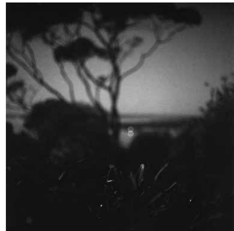
HRANICE MODRÉ THE LIMIT OF BLUE, 2019 100 x 100 cm ▶ LightJet osvit na Fuji Crystal Archive adjustace na dibond edice 1 kus