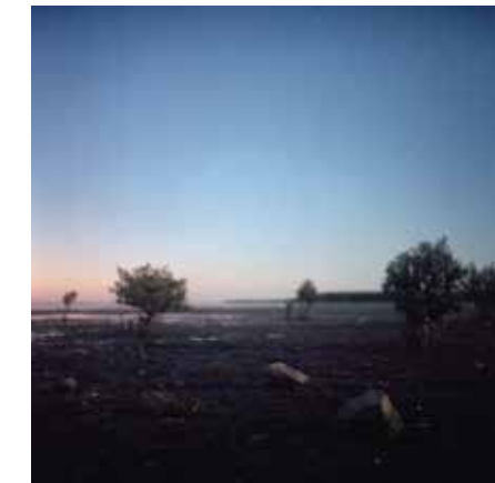
HRANICE MODRÉ THE LIMIT OF BLUE, 2019 100 x 100 cm ▶ LightJet osvit na Fuji Crystal Archive adjustace na dibond edice 1 kus