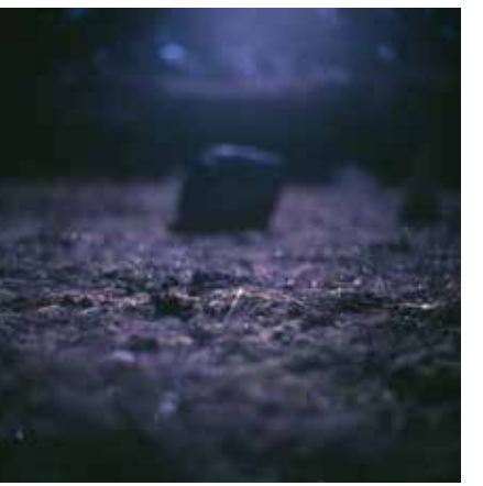
HRANICE MODRÉ THE LIMIT OF BLUE, 2019 100 x 100 cm ▲ LightJet osvit na Fuji Crystal Archive adjustace na dibond edice 1 kus