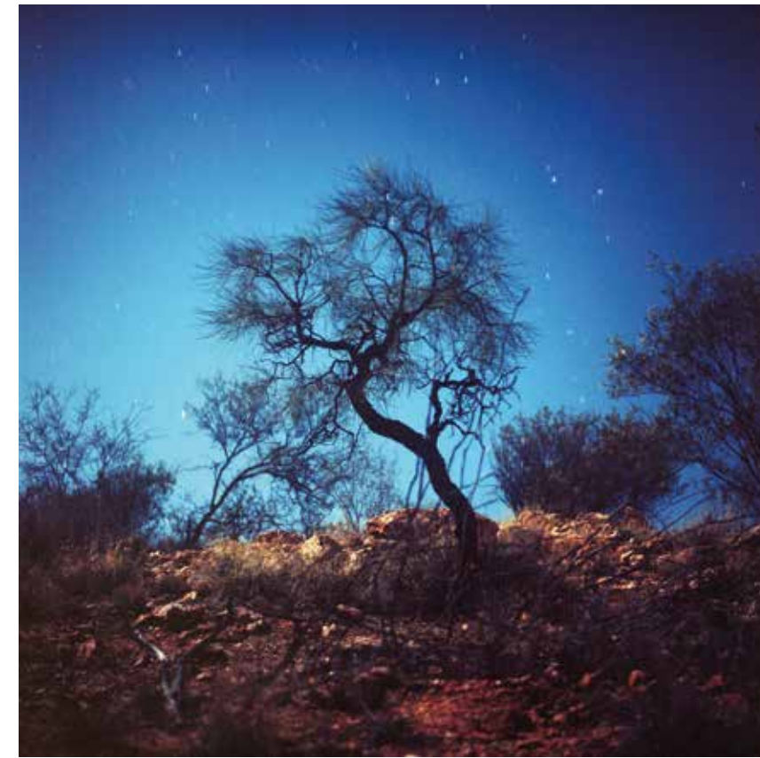
HRANICE MODRÉ THE LIMIT OF BLUE, 2019 100 x 100 cm ▲ Print na Polimat laser 090 MIC edice 1 kus