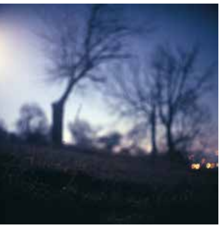
HRANICE MODRÉ THE LIMIT OF BLUE, 2019 100 x 100 cm ▲ LightJet osvit na Fuji Crystal Archive adjustace na dibond edice 1 kus