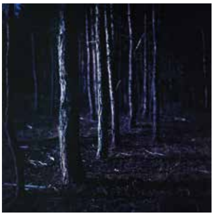
HRANICE MODRÉ THE LIMIT OF BLUE, 2019 100 x 100 cm ▲ LightJet osvit na Fuji Crystal Archive adjustace na dibond edice 1 kus