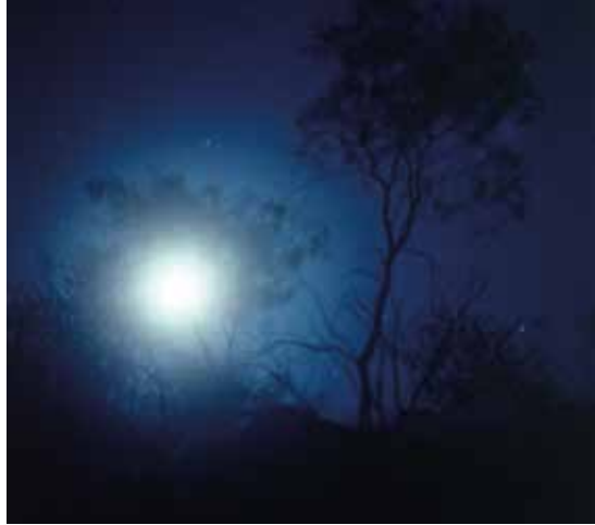
HRANICE MODRÉ THE LIMIT OF BLUE, 2019 100 x 100 cm ▲ Print na Polimat laser 090 MIC edice 1 kus