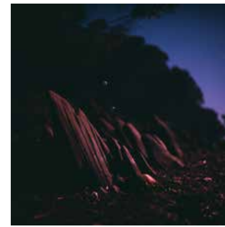
HRANICE MODRÉ THE LIMIT OF BLUE, 2019 100 x 100 cm ▲ LightJet osvit na Fuji Crystal Archive adjustace na dibond edice 1 kus