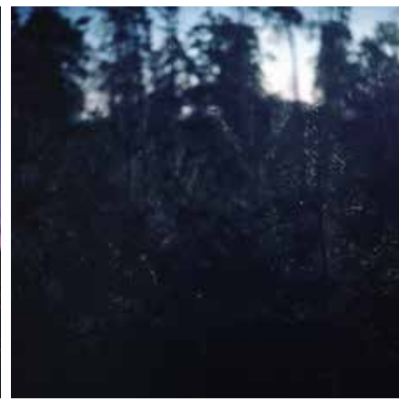
HRANICE MODRÉ THE LIMIT OF BLUE, 2019 100 x 100 cm ▲ LightJet osvit na Fuji Crystal Archive adjustace na dibond edice 1 kus