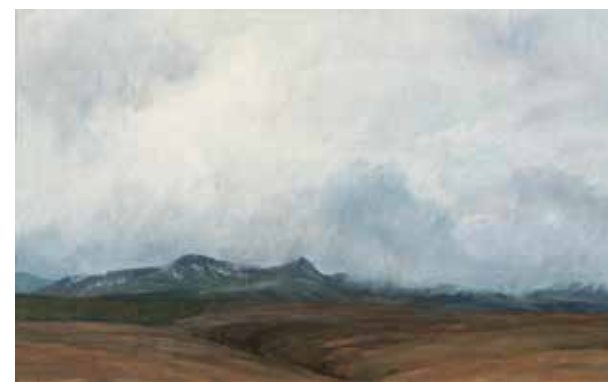
IVANA MRÁZKOVÁ Storr, 2017 olej, plátno