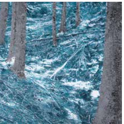
ALENA KOŽENÁ Les, 2018 barevná tuš, fólie, kombinovaná technika