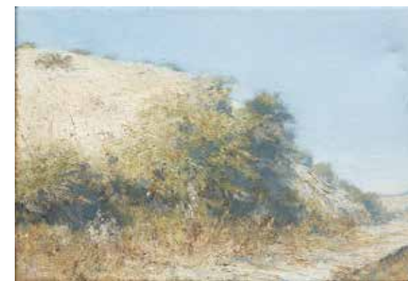
ONDŘEJ MINÁŘ U nádraží, 2016 olej, plátno