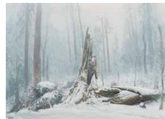
ADAM KAŠPAR Františkov, 2017 olej, plátno