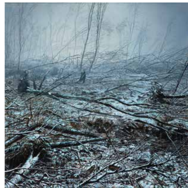
IVANA MRÁZKOVÁ Novohradské hory, 2017 olej, plátno