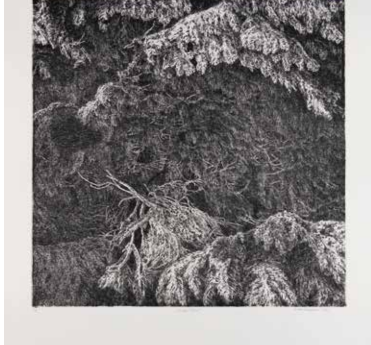
LENKA FALUŠIOVÁ Stezka ticha, 2014 čárový lept