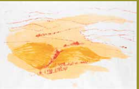
EVA VÁPENKOVÁ Běhařov II, 2016 akvarel, barevná tuš, japonský rýžový papír