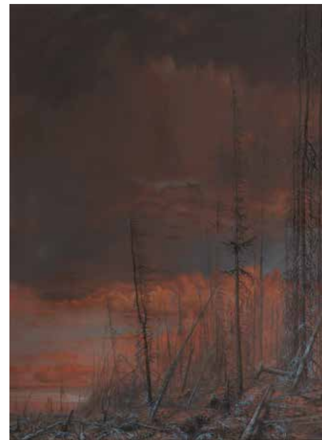
MICHAL NAGYPÁL Kalamita, 2018 olej, plátno