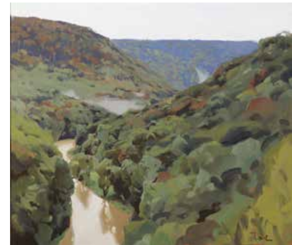
TOMÁŠ HONZ Zelené údolí, 2018 olej, plátno