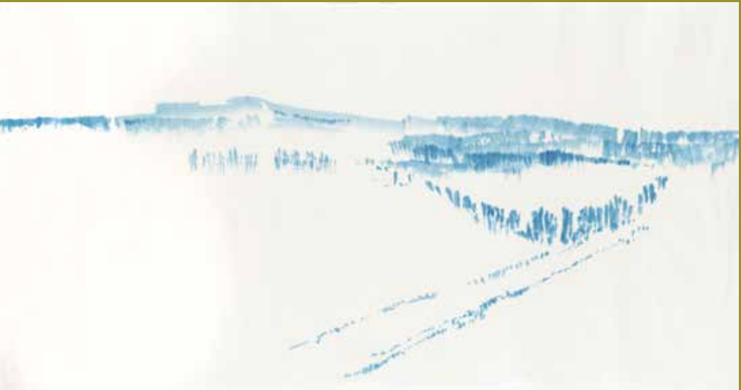
EVA VÁPENKOVÁ Běhařov – horizont, 2016 barevná tuš, japonský rýžový papír