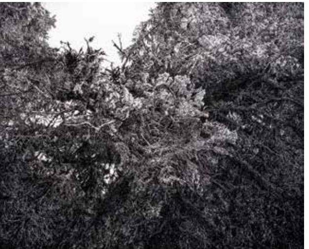
LENKA FALUŠIOVÁ Inscape, 2018 tuš, papír