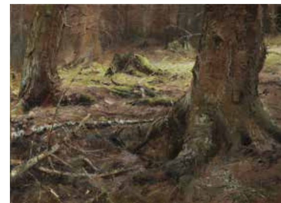
ONDŘEJ MINÁŘ Světlo v lese, 2017 olej, plátno