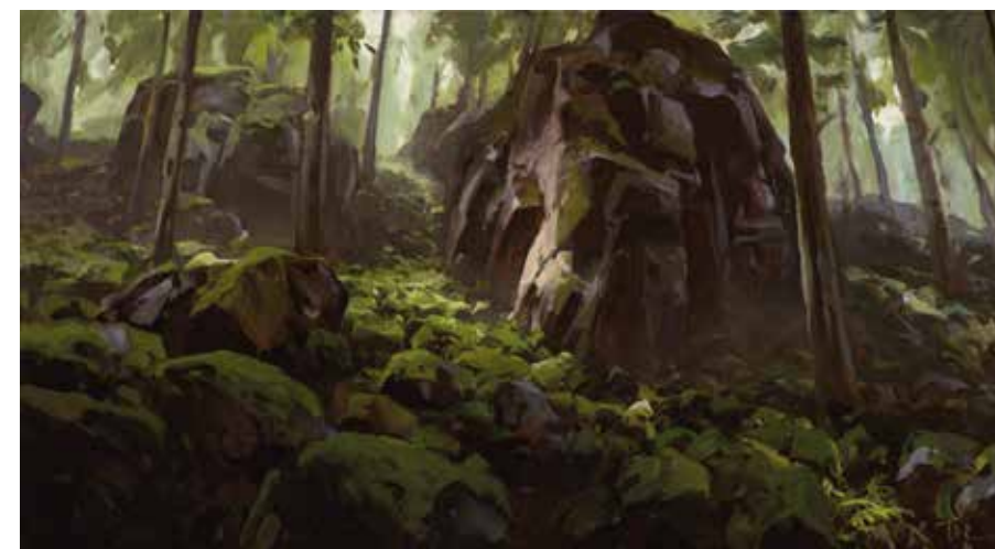
ADAM KAŠPAR Pod zadním Hutiskem, 2017 olej, plátno