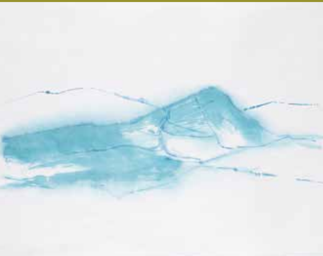
EVA VÁPENKOVÁ Lysá hora, 2015 akvarel, barevná tuše, japonský rýžový papír