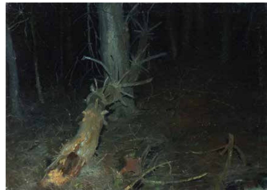
ONDŘEJ MINÁŘ Lesní noc, 2017 olej, plátno