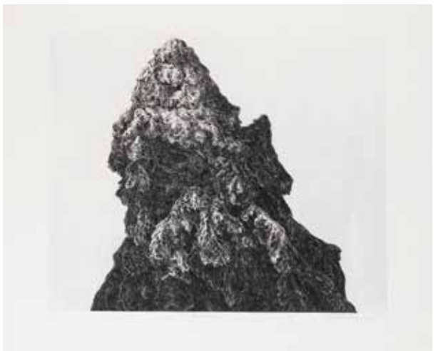
LENKA FALUŠIOVÁ Duch místa, 2015 čárový lept