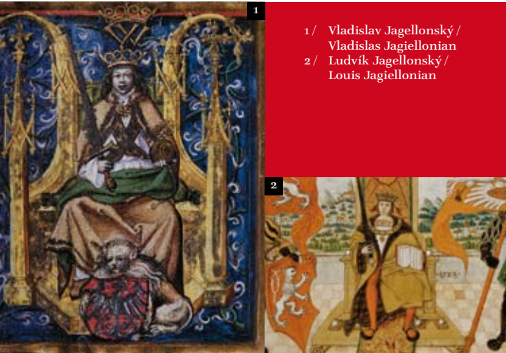
1/ Vladislav Jagellonský / Vladislav Jagiellonian

Padělatelé neškodí jen jednotlivci, kterého podvádějí, ale hlavně státu, v jehož pravomoci se peníze vydávají. Padělání měny (za účelem poškození nepřátelské ekonomiky) patřilo také mezi často používanou válečnou taktiku. V sedmdesátých letech 15. století se Milánská svobodná republika snažila podkopat stabilitu konkurenčních Benátek paděláním dukátů. Napoleon padělal rakouské a ruské bankovky, pruský král Fridrich Veliký v období sedmileté války napadl hned několik měn najednou.