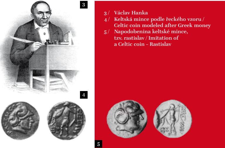
3/ Václav Hanka