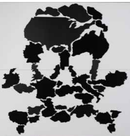
Lovkyně a sběrači, dibond, 2017

Dílo poukazuje na obrácené role žen a mužů v současné společnosti. Ženy se stávají "lovkyněmi" a muži pasivními "sběrači". Formálně jde o postavy skutečných lidí z ulice, jejichž stíny jsem nakreslila a které jsem nechala vyřezat z moderního materiálu. Následně jsem použila atributy, které jsou příznačné pro mladou generaci: CD — hudba, jízdenky — cestování, platební karty — symbol nakupování. Těmito atributy jsem postavy pokryla.