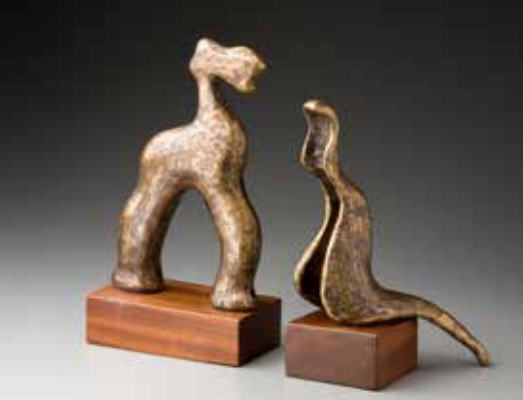
Koník pro Mayku, Zvíře z našeho podkrovní, bronz, 2008