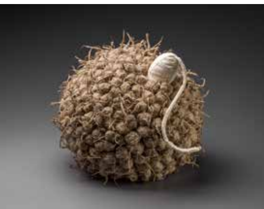
Zplození, textil, koudel, 2005