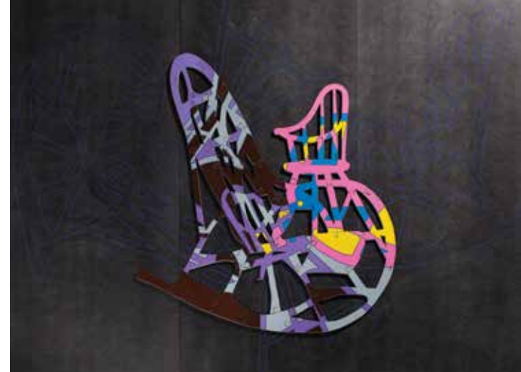
Puzzle, MDF deska, barevné spreje, lepicí páska, 2010

Tématem je soužití dvou generací: malého dítěte a starého člověka. Starého člověka představuje houpací křeslo a dítě dětská stolička. Stíny se vzájemně proplétají, tak jako jsou propletené vztahy v rodině. Barvy dětské stoličky jsou hravé, jako je dětský svět. Houpací křeslo je tmavší.