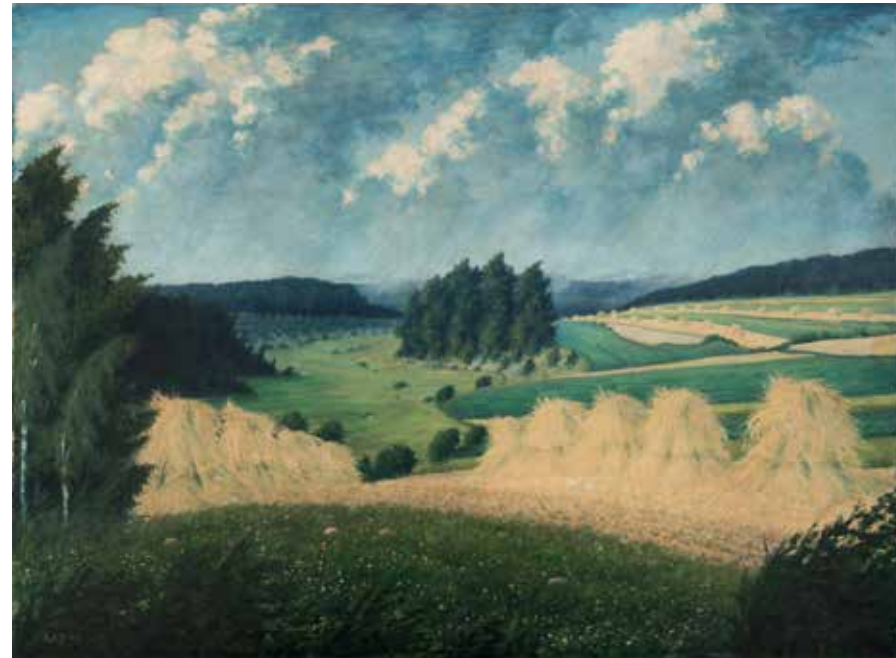
Antonín Bilek, Žně Signováno: Ant. Bilek Pobočka ČS Praha 1