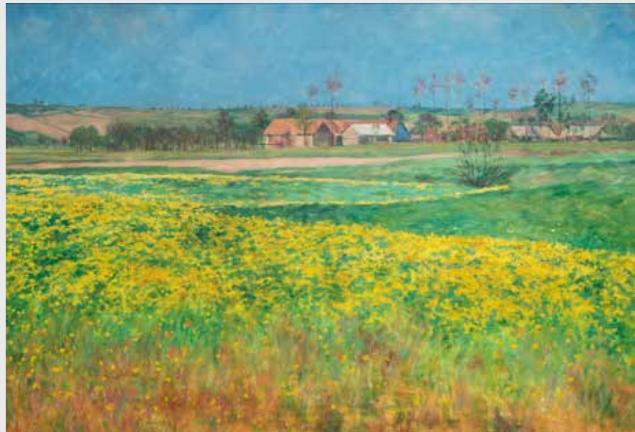
František Kaván, Jaro v Jevanech Pobočka ČS Hlinsko v Čechách