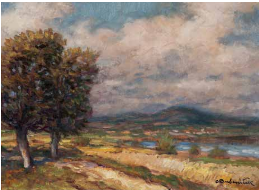
Ota Bubeníček Krajina na Semilsku Signováno: O. Bubeníček Pobočka ČS Semily

Své malířské vzdělání získal soukromým, nikoli akademickým studiem a to v Mnichově a ve Švýcarsku. Po roce 1918 se vrátil do Čech a působil i Jaroměři a v Pardubicích. Byl především krajinářem, i když okrajově se pokoušel i o figurální malbu.